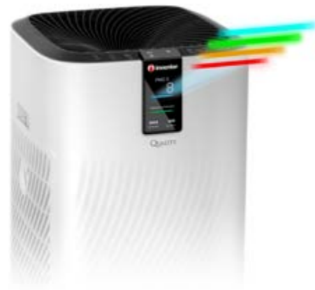
Δείκτης Ποιότητας Αέρα

Εξασφαλίστε καθαρό & υγιεινό αέρα στον χώρο σας χάρη στην αποτελεσματικότητα των 6 σταδίων φιλτραρίσματος και του Ιονιστή. Το υψηλό επίπεδο φιλτραρίσματος με δυνατότητα συγκράτησης του 99,97% των σωματιδίων μεγέθους έως 0,3μικρόμετρα σας εγγυάται την άριστη ποιότητα του αέρα στον χώρο σας, ενώ ο Ιονιστής παράγει ιόντα εξαλείφοντας μυρωδιές, σκόνη και καπνό.