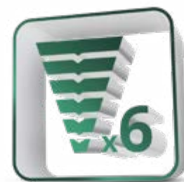
6 Στάδια Καθαρισμού Αέρα & Ιονιστής