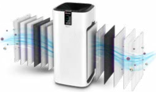
6 Στάδια Καθαρισμού Αέρα & Ιονιστής