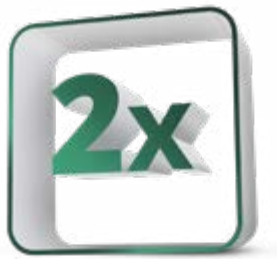
Διπλό Σύστημα Φιλτραρίσματος