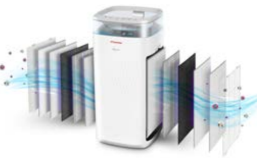
Διπλό Σύστημα Φιλτραρίσματος