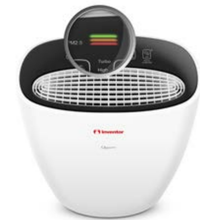
Δείκτης Ποιότητας Αέρα

Το δραστικό φίλτρο HEPA (κλάσης H11), με δυνατότητα κατακράτησης του 97,5% των σωματιδίων μεγέθους έως 0,3μικρόμετρα σας εγγυάται την άριστη ποιότητα του αέρα στον χώρο σας. Απολαύστε καθαρή ατμόσφαιρα στον χώρο σας και μειώστε δραστικά τις πιθανότητες εμφάνισης αλλεργιών και ασθενειών, πάντα με την έγκυρη πιστοποίηση από το Ευρωπαϊκό Ίδρυμα Ερευνών Αλλεργιών, ECARF.