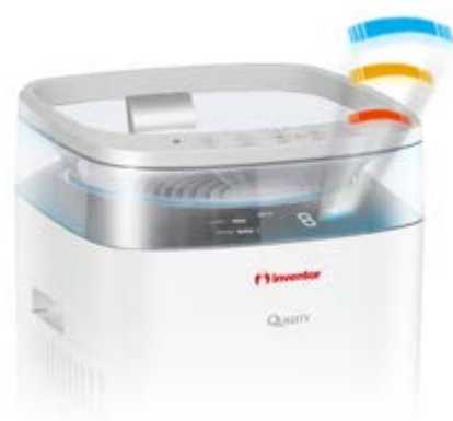
Δείκτης Ποιότητας Αέρα

Εξασφαλίστε αποτελεσματική δράση καθαρισμού αέρα και ταχύτητα αποτελέσματα στην απόκτηση ιδανικής ατμόσφαιρας στον χώρο σας, χάρη στο διπλό σύστημα φιλτραρίσματος που διαθέτει η συσκευή! Μεγάλης επιφάνειας φίλτρα είναι τοποθετημένα στις δύο πλευρές της συσκευής με αποτέλεσμα μεγαλύτερη ποσότητα αέρα να εισάγεται στον καθαριστή αέρα και να φιλτράρεται. Με αυτό τον τρόπο, απολαμβάνετε διπλά οφέλη, εξασφαλίζοντας τόσο ιδανικές συνθήκες καθαρού & υγιεινού αέρα στον χώρο σας όσο και εξοικονόμηση χρόνου & ενέργειας.